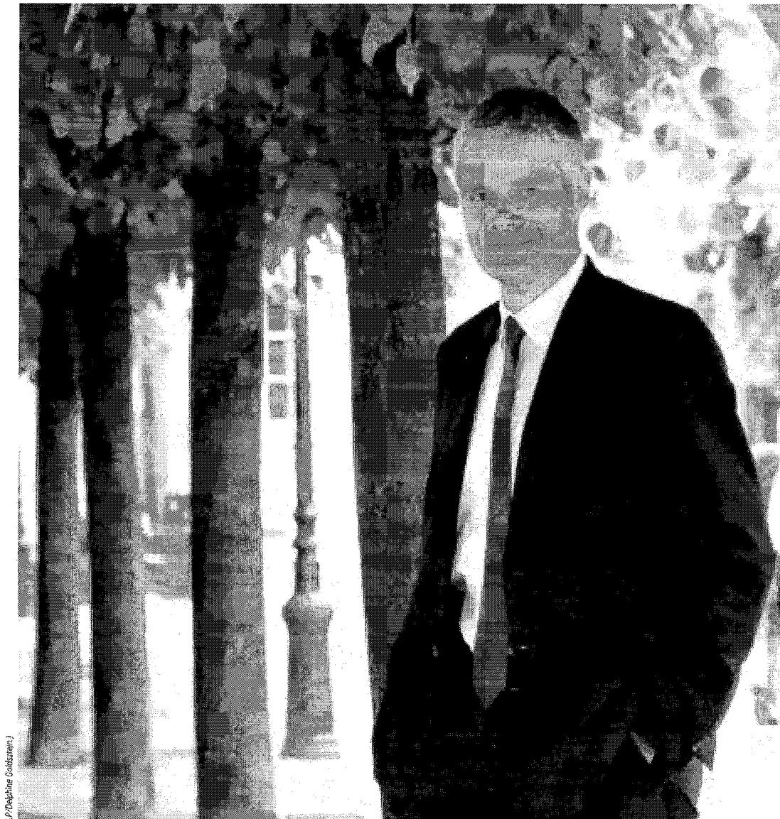
(P. Delphine Goldberg)

Paris, mercredi. Pour Laurent Wauquiez, « les choses sont simples : aucun accord avec le FN » ne doit être passé pour les municipales.